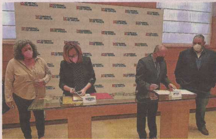
Firma del convenio de Plena inclusión Aragón y el Gobierno de Aragón.

Ahora trabajan juntos para hacer más accesible la Justicia a quienes tienen problemas para entenderla.