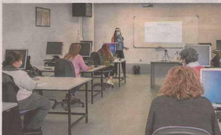
Los cursos se realizan con todas las medidas de seguridad. DFA

Los Centros de Formación de DFA inician una nueva convocatoria de cursos gratuitos y abiertos a toda la ciudadanía que comenzarán en marzo. Se trata de acciones formativas dirigidas a personas en situación de desempleo financiadas por el Inaem. Algunos cursos se