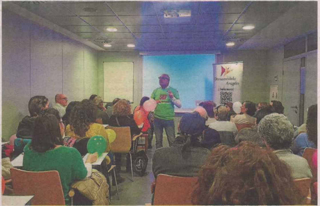
Talleres sobre inteligencia emocional en el Centro Joaquín Roncal CAI (imagen de archivo), DONA MÉDULA ARAGÓN

Según el Departamento de Sanidad de la DGA, en 2020 la actividad de donación y trasplante de órganos ha estado marcada por la crisis sanitaria. A pesar de la pandemia, el pasado año en Aragón se registraron 337 donantes de progenitores hematopoyéticos. Con cada persona que se inscribe en el Banco de Sangre y Tejidos de Aragón, centro de referencia en la comunidad, nace la oportunidad y la esperanza de salvar una vida.